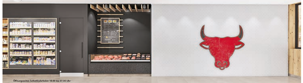
Öffnungszeiten Selbstbedienung 18:00 bis 07:00 Uhr