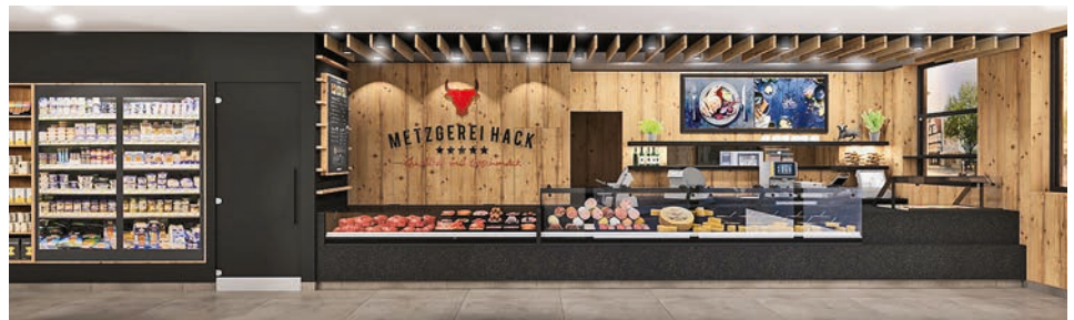
Öffnungszeiten Bedientheke 7:00 bis 18:00 Uhr

Flexibilität hört nicht bei den Öffnungszeiten auf, wie die vielen Selbstbedienungskonzepte zeigen. Dieser Laden kombiniert die traditionelle Bedienung über die Theke (oberes Bild) während der üblichen Öffnungszeiten mit einem Selbstbedienung-/Selbstzahlerbereich (unteres Bild) nach Ladenschluss. Dann bleibt nur noch der Selbstbedienungsladen geöffnet, Zugang und Bezahlung erfolgen über EC-Karten-Registrierung.